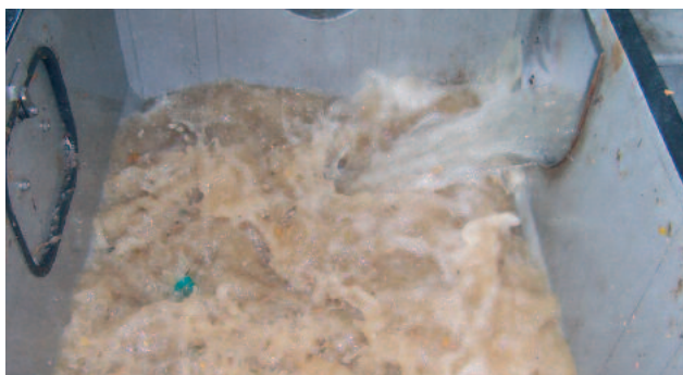
Turbulenssi on korkea pesukaukalossa kun potkuripumppu käy

Välpe tippuu suoraan välpistä tai kuljettimesta välpepesurin pesukaukaloon. Välpättyä jätevettä syötetään pesukakaloon pesuvedeksi.