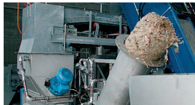
Hyvin pesty ja näennäisesti hajuton välpe HUBER WAP/SL välpepesurista, kiintoainepitoisuus jopa 50 % TS