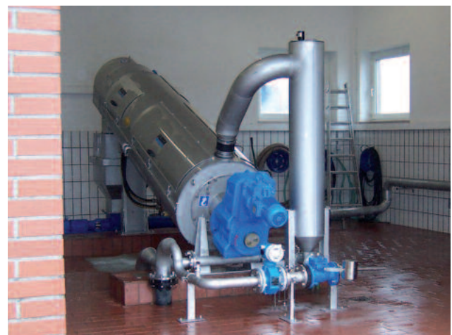
ROTAMAT® Ruuvikuivain RoS 3 , kapasiteetti 8 m 3 /h