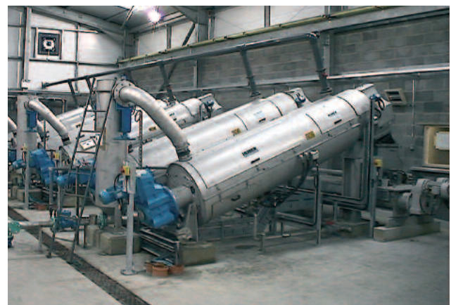
Useampi rinnan asennettu ROTAMAT® Ruuvikuivain RoS3