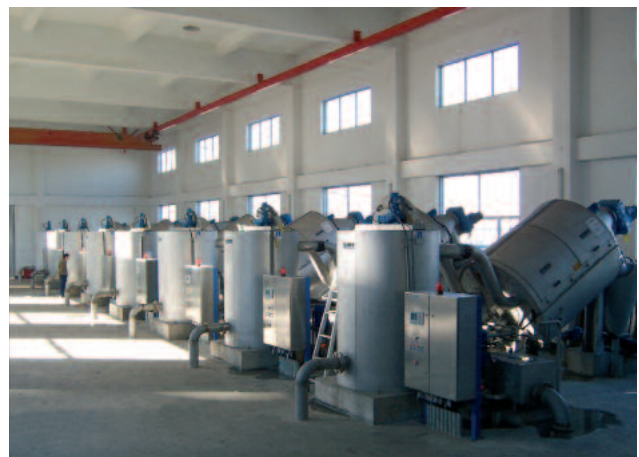
Useampi laite rinnakkain käsittelemään 600 m 3 /h