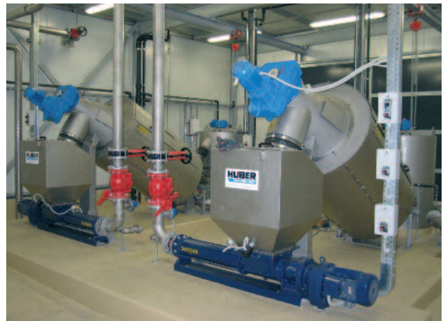
Kaksi S-DRUM laitetta, 80 m 3 /h

Yli 500 asennusta ympäri maailman todistaa että ROTAMAT® Ruuvitiivistin S-DRUM on luotettava valinta.